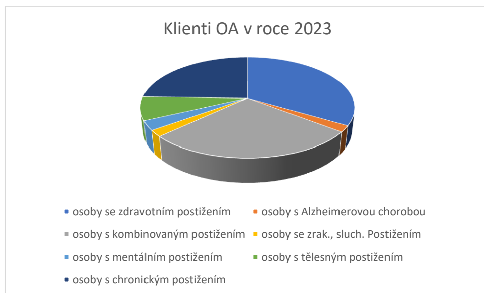
Graf. č. 2 Klienti osobní asistence v roce 2023

V průběhu roku 2023 odpovídalo registračním podmínkám a zákonu o sociálních službách č. 108/2006 Sb. Všechny sociální pracovnice a osobní asistenti byli zapojeni do celoživotního vzdělávání a absolvovali předepsaný počet hodin odborného vzdělávání s platnou akreditací MPSV ČR.